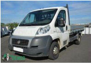
Fiat Ducato Véhicules utilitaires (-3,5 t)

d'azote. Un parti pris qui permet de se passer de système SCR et donc d'additif AdBlue. Le nouveau positionnement du système de traitement des gaz d'échappement améliore, quant à lui, l'efficacité du filtre à particules qui dispose d'une fonction d'autorégénération (manuelle ou automatique) et ne nécessite donc aucune intervention d'entretien.