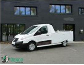
Fiat Scudo Véhicules utilitaires (-3,5 t)