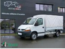
Renault Master Traction Véhicules utilitaires (-3,5 t)